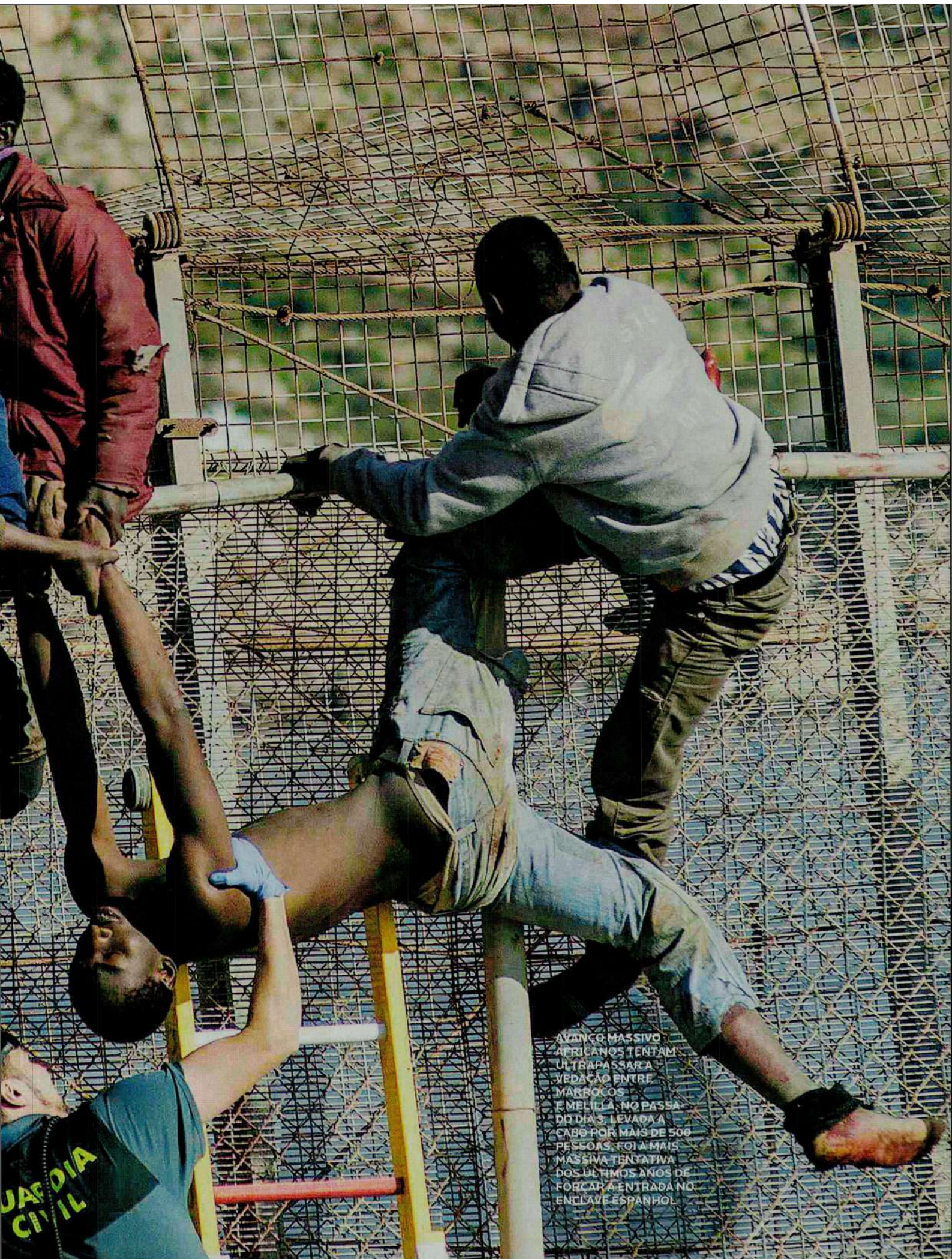
AVANÇO MASSIVO AFRICANOS TENTAM ULTRAPASSAR A VEDAÇÃO ENTRE MARRUCOS E MELILLA, NO PASSA- DO DIA 3. LEVADA A CABO POR MAIS DE 500 PESSOAS, FOI A MAIS MASSIVA TENTATIVA DOS ÚLTIMOS ANOS DE FORÇAR A ENTRADA NO ENCLAVE ESPANHOL